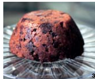
1 クラシックな雰囲気を残す店内 2 上品に盛り付けられた料理 3 デザートにもぜひトライしたい

110 S. Pitt St Alexandria, VA 22314 (bet King & Prince Sts) Tel (703) 706-0450 www.restauranteve.com L 月～金 11:30-14:30 D 月～土 17:30-21:30 B L D King Street