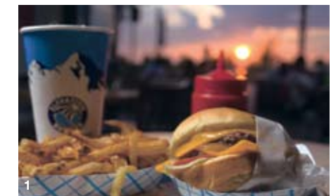
1 厳選された食材を使ったハンバーガー 2 青い山のロゴが目印

ファイブ・ガイズと並び、東海岸で急成長中のハンバーガー店。フロリダで生まれた店だが、2005年にバージニア州北部に支店がオープンして以来、ワシントンDC周辺でも人気に火が付いた。オーガニックの牛肉を使ったハンバーガー、オリーブオイルで揚げられたフライドポテトなど、健康に配慮した食材が使われているのが特徴。