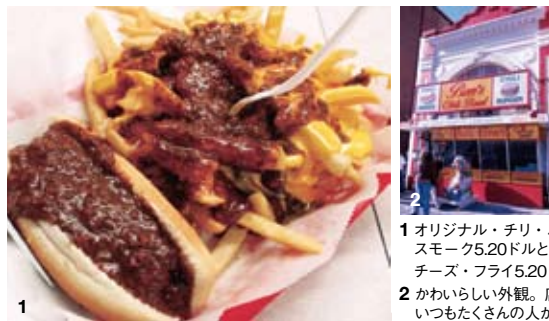
1 オリジナル・チリ・ハーフ・スモーク5.20ドルと、チリ・チーズ・フライ5.20ドル 2 かわいらしい外観。店先にはいつもたくさんの方が並ぶ

オバマ大統領がお忍びで訪れたことでも話題になった、50年の歴史を持つチリの店。ボウルでいただくチリ・コン・カルネはもちろん、チリドッグやチリバーガー、ベジタリアンチリなど、さまざまな形でチリが楽しめる。チリ以外にも、ツナサンドイッチやベジバーガー、ブラックファストでは卵料理やホットケーキ、フレンチトーストもある。価格はいずれも4~8ドル程度。