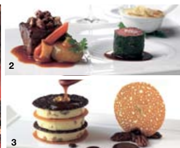
1 店はホテルの中にある 2 柔らかなジュエリーなバーベキュー・ショート・リブ 3 人気のデザート、バター・ピーカン・アイスクリーム 4 豪華な装飾が施された店内

309 Middle St Washington, VA 22747 (nr Gay St) Tel (540) 675-3800 www.theinnatlittlewashington.com D 月～金 18:30-21:30 土 17:00-21:30 日 16:30-20:15