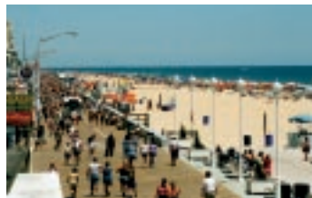
どこまでも続くボードウォーク

このビーチのハイライトは、全長3マイルのボードウォーク。各メディア誌上で“ベスト・ボードウォーク”と絶賛される理由は、よそのビーチでは見られない、充実したレクリエーションの数々。サイクリングやウォーキングはもちろんのこと、観覧車や回転木馬、コースターライドなどが楽しめるアミューズメントパークが隣接する。また、売店も立ち並んでおり、