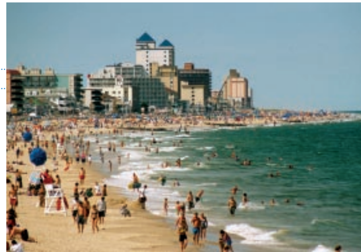
海辺のパカンスを 思いっきり満喫しよう

ビーチで遊び疲れたら簡単に腹ごしらえできても便利。ボードウォークの南端にある「ライフ・セービング・ステーション博物館」では、オーシャン・シティーの歴史や、ライフ・セービングにまつわる展示内容を紹介している。なお、3両編成のかわいらしいトラムがボードウォーク沿いを巡回しているので、トラムに乗ってひと味違った海の景色を楽しんでみるのもよい（夏季のみ運行。運賃は平日2.75ドル、週末3ドル）。