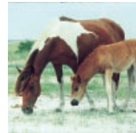
野生のポニーが暮らす アサティーク・アイランド

オーシャン・シティーから南へ9マイル、野生のポニーたちが暮らす「アサティーク・アイランド」が大西洋上に浮かぶ。長い年月をかけて荒波と海風で形作られたこの島には、300頭以上のポニーが息づく。メリーランド州側は「アサティーク・アイランド国立海浜公園」と呼ばれ、放し飼いにされているポニーを間近で見ることができる。一方、バージニア州側の「シンコティーク・アイランド国立野生海浜公園」ではポニーたちが管理されているため、決められた場所で見ることができない。ツアーに参加して島内を回ったほうが効率よい。毎年7月下旬に行われる「シンコティーク・ワイルド・ポニー・スイム」は、島あげての一大イベント。150頭以上のポニーたちが、アサティーク海峡を泳いでシンコティーク・アイランドへと渡る景色は、じつに豪快だ。