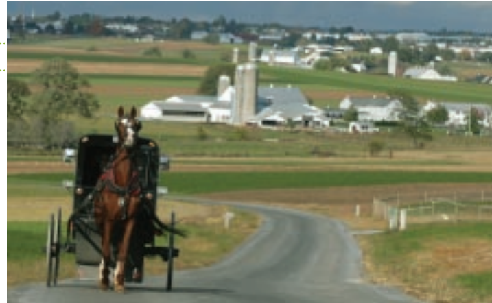
アーミッシュ村ののどかな田園風景

アメリカで最もアーミッシュ人口が多いペンシルバニア州。ノスタルジックな田舎の風景と独特の文化が息づく「ランカスター」には、その昔宗教の自由を求めてヨーロッパからやってきたアーミッシュの子孫たちが多く暮らしている。