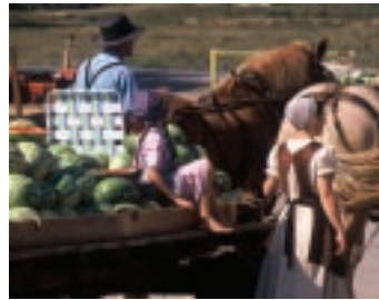
昔ながらの暮らしを営んでいるアーミッシュ

家族の絆を何よりも大切にしているアーミッシュ。現代人が求める“進歩”や“テクノロジー”は、彼らにとって“豊かな生活”を意味しない。電気や車を使わず、信仰に基づいた昔ながらの素朴な生活を営んでいる。「アーミッシュ・ファーム&ハウス」は、そんな彼ら独自の生活が体験できる場所のひとつ。200年以上